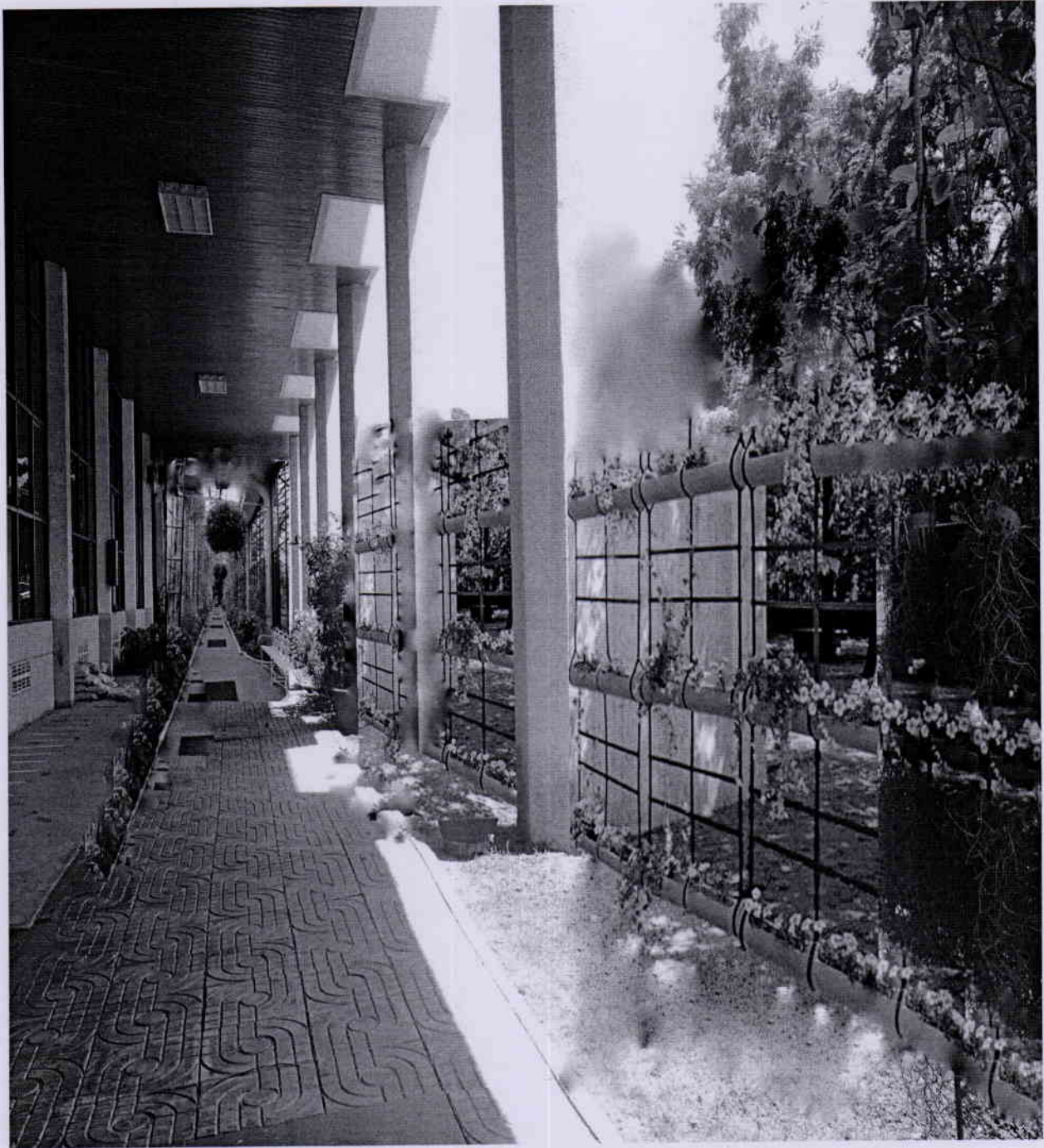
รูปแบบการจัดสวนแนวตั้ง