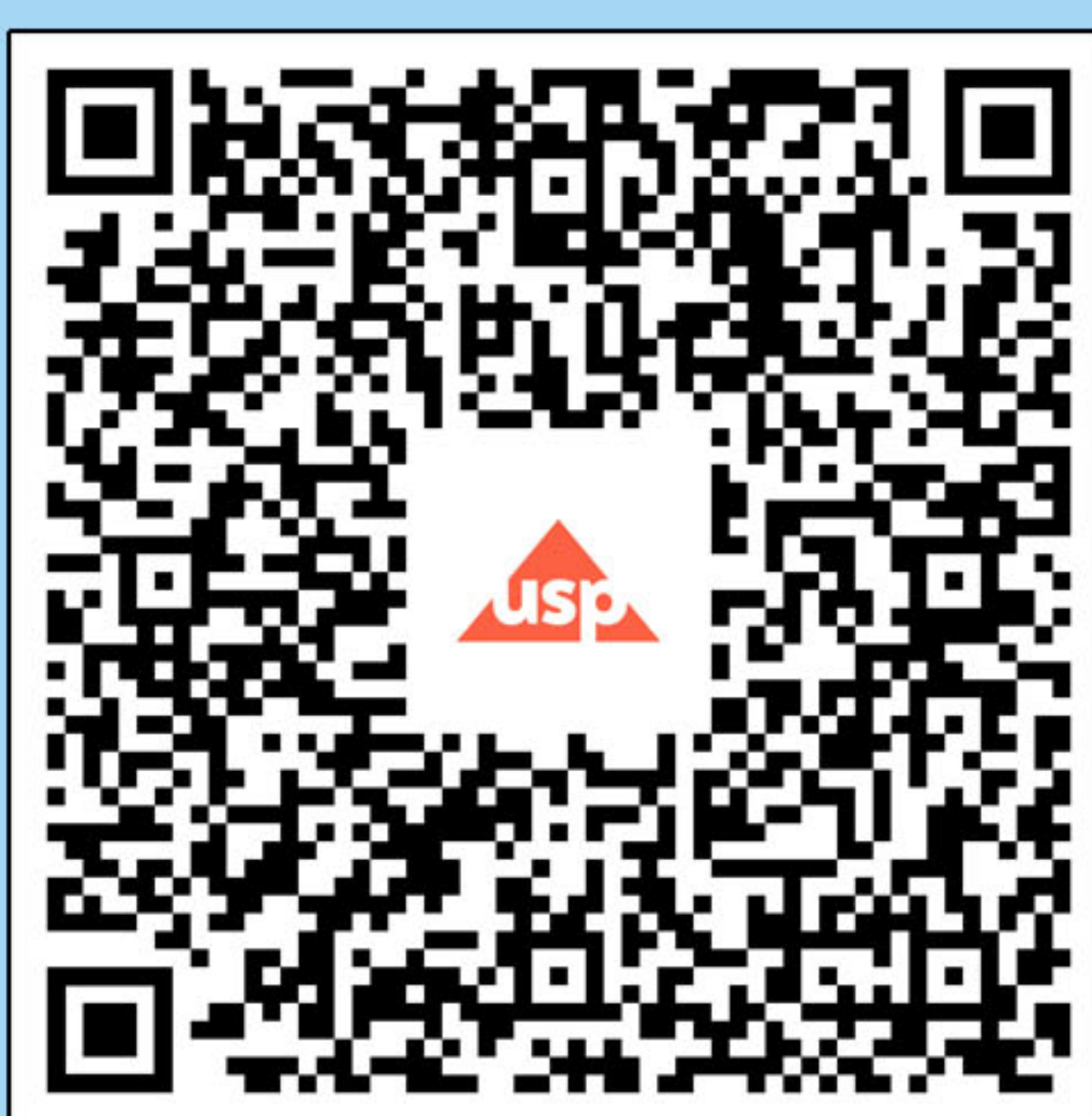
สแกนลงทะเบียน